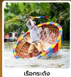
เรือกระดง

ไฮไลท์! นั่งกระเช้าขึ้น ยอดเขามานาฮิลล์ สวนสนุกแฟนตาซีปาร์ค ชมอารยธรรมโบราณแห่งเมืองฮอยอัน นั่งเรือกระดง สุดตื่นเต้น