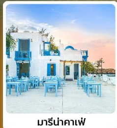
มาร์นาคาเฟ่