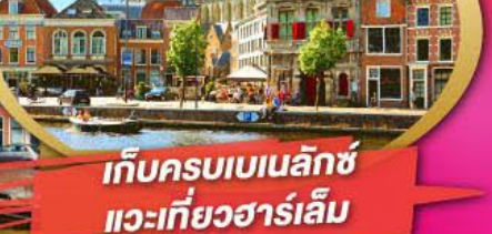
เก็บครบเบเนลักซ์ แวะเที่ยวฮาร์เล็ม