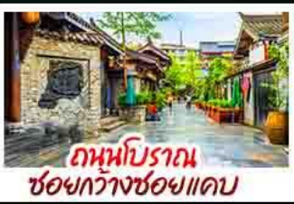
ถานโบราณเซอชวงกวางชอยแคบ