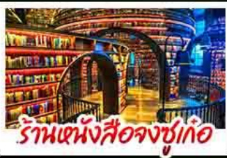
ร้านหนังสือจงชู่เก้อ