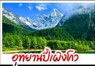
อุทยานป่าเผิงโกว

อุทยานสัตว์ดุณี - อุทยานป่าเผิงโกว - เมืองตูเจียงเซียง - รูปปั้นเขมรแพนด้าหนอนเซ็คฟี ร้านหนังสือจงชู่เก้อ - ล่องเรือชมเขลวงฟ้อโตเล่อซาน - ถานโบราณเซอชวงกวางชอยแคบ - วัดต้าซือ ถนนคนเดินชุนชิว - เขมรแพนด้าปิ่นตึกIFS - ถานที่ทุกุเศ็ค - ชมแสงสีน้ำพี้ไม้อีฟตีก SKP - ชมตึกแฟอเจิงตุ