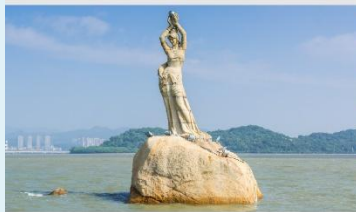
จูไห่พีชเชอร์เกิร์ล(หวีหนี่)