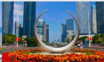
จัตุรัสฮัวเจิง

*ทางบริษัทฯ ขอสงวนสิทธิ์ในการสลับโปรแกรมทัวร์ตามความเหมาะสมขึ้นอยู่กับสถานการณ์หน้างาน โดยคำนึงถึงผลประโยชน์ของลูกค้าเป็นสำคัญ