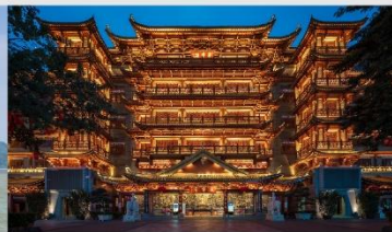
วัดต้าฝอซื่อ