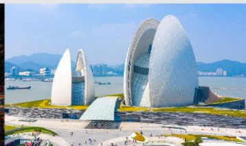
โรงละครหอยไข่มุก