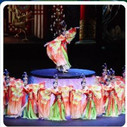
โชว์ FOSHAN QIANGUING