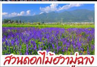
สวนดอกไม้ฮัวมู่ฉาง