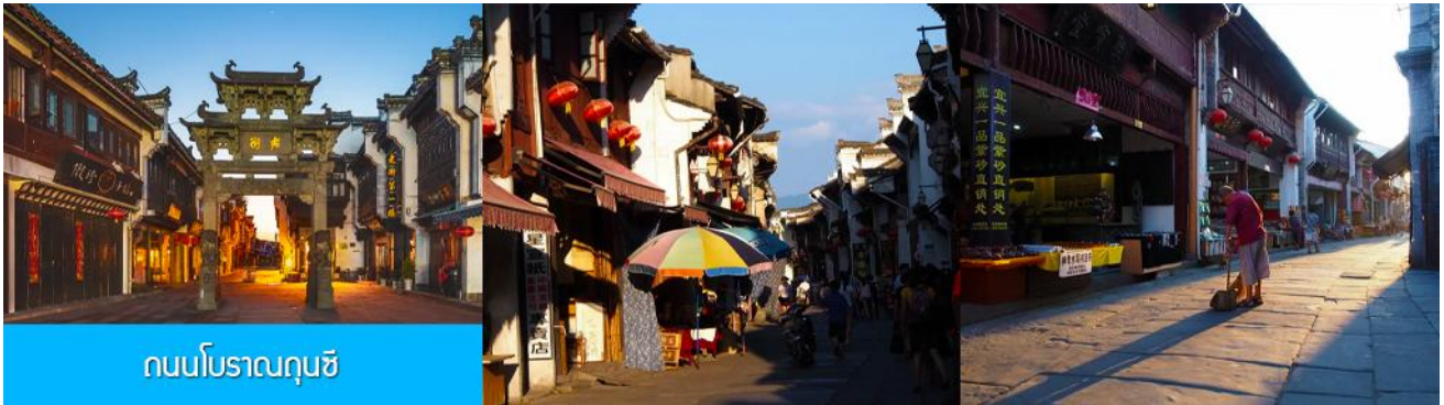
ถนนโบราณถุนซี

อิสระอาหารมื้อกลางวัน ( ท่านสามารถเลือกชิมอาหารพื้นเมืองในระแวกโรงแรมได้ตามอัธยาศัย )