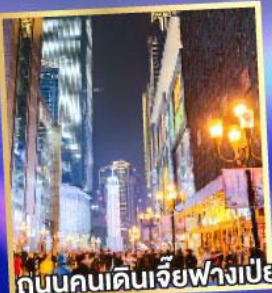
ถนนคนเดินเจียวฟางเป่ย์