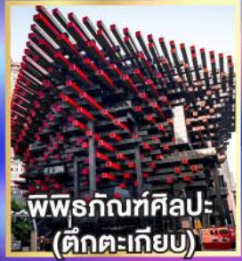
พิพิธภัณฑ์ศิลปะ (ตึกตะเกียบ)