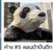
ห้าง IFS แพนด้าปิ่นตึก