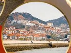
ซาจือโข่ว