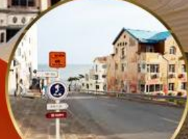
ถนนอ่าวจวีป่า