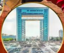
ประตูแห่งความสุข