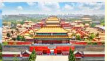
พระราชวังต้องห้ามปักกิ่ง

*ทางบริษัทฯ ขอสงวนสิทธิ์ในการสลับโปรแกรมทัวร์ตามความเหมาะสมขึ้นอยู่กับสถานการณ์หน้างาน โดยคำนึงถึงผลประโยชน์ของลูกค้าเป็นสำคัญ