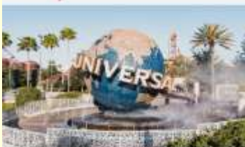
สวนสนุกยูนิเวอร์เซลปักกิ่งสตูดิโอ