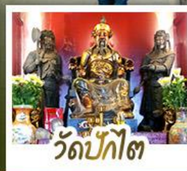
ว้ดป้กไต้