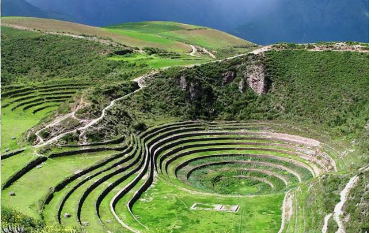
บาย นำท่านเดินทางสู่ มาราซ (Maras) แหล่งผลิตเกลือที่คุณภาพดีที่สุดในโลก ที่มีมาตั้งแต่สมัยอินคา แนว นาขั้นบันไดที่เรียงอยู่ตามลำดับความสูงของภูเขา จากนั้นเดินทางสู่ โมเรย์ (Moray) นาขั้นบันไดวงกลมขนาดใหญ่หลายารูปทรงแปลกตาที่ชาวอินคาทำ ไว้เพื่อทดลองปลูกพืชพันธุ์ต่างๆ จากจุดนี้สามารถมองเห็น หมู่บ้านอุрубัมบา (Urubamba) ได้อีกด้วย ได้เวลาเดินทางกลับสู่เมือง เมืองคัสโก (Cusco) เมืองหลวงของอาณาจักรอินคา ที่แพร่ขยายอำนาจจน กินพื้นที่ 1 ใน 3 ของอเมริกาใต้ ตั้งอยู่เหนือระดับน้ำทะเลถึง 3,400 เมตร และเป็นแหล่งอารยธรรมยุค ก่อนประวัติศาสตร์ที่ลึกลับน่าทึ่ง เป็นชุมชนเก่าแก่ของจักรวรรดิอินคาอันรุ่งเรือง ซึ่งยังคงทิ้งร่องรอยความ เจริญไว้ให้เห็นเป็นซากปรักหักพังโบราณและโบราณวัตถุต่างๆ