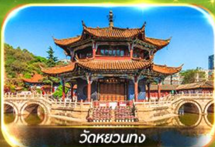
วัดหยวนทาง