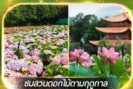
ชมสวนดอกไม้ตามฤดูกาล

นั่งกระเช้ากุเขาศิมะเจี้ยวจื่อ ชมน้ำตกสุดอลังการสวนน้ำตกคุนหมิง ช้อปปิ้งถนนคนเดินหนานผิงเจี๋ย, ชมดอกไม้ตามฤดูกาล