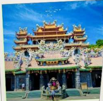
วัดกวนตู่