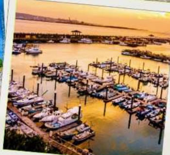
ท่าเรือประมงตั้นส่วย