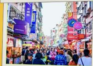
ถนนโบราณทันสมัย