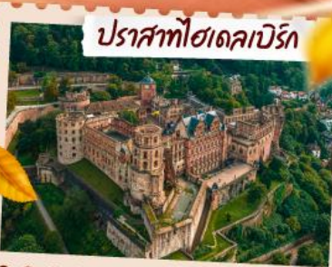
ปราสาทโวลแลนเบิร์ก