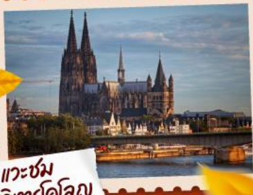
แวะชม มหาวิหารโคโรลญ