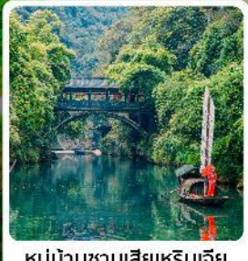
หมู่บ้านซานเสี่ยเหรินเจีย