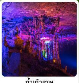
ตำเก้าทพ