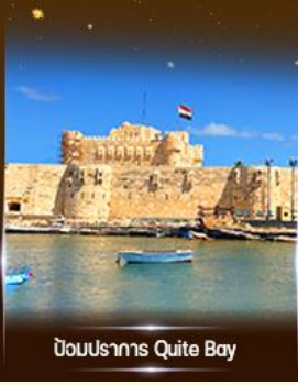
บึงอนุสาวรีย์ Quite Bay