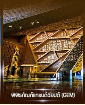
พิพิธภัณฑ์แกรนด์อียิปต์ (GEM)