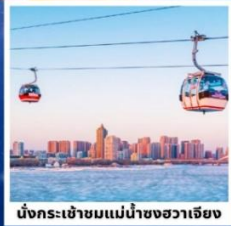
นั่งกระเช้าชมแม่น้ำซงฮวาเจียง