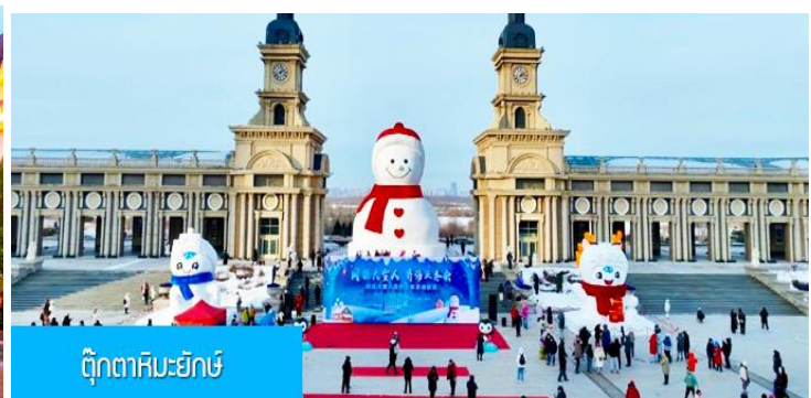
ตุ๊กตาคิมะยักซ์