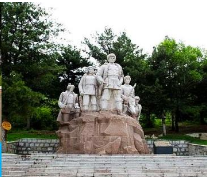
อนุสาวรีย์พิงหวง