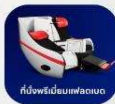
ที่นั่งพรีเมียมแฟลตเบด