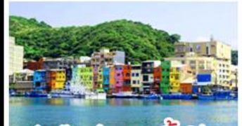
ทำเรือประมงเจิ้งปิ่น

รถไฟสายโบราณอาลีซาน - ตึกไทเป 101 ประมงเจิ้งปิ่น - จิวเฟิ่น - ล่องเรือทะเลสาบสุริยันจันทรา ถนนเมบูเค็ด เสี่ยวหลงเป่า & ปลายประธาราธิบดี ช้อปปิ้ง 3 ย่านคิง : ซีเหมินคิง - ไถจงไนท์มาร์เก็ต - MITSUI OUTLET