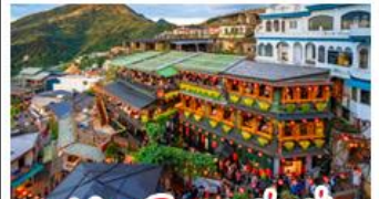
หมู่บ้านโบราณจิ่วเฟิ่น