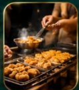
สตรีทฟู้ดชื่อดัง