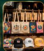
ของฝากเก๋ ๆ