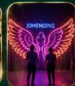
จุดเช็คอินสุดฮิต