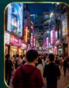
แหล่งช้อปปิ้งแฟชั่นสุดฮิต