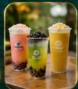
เครื่องดื่มยอดนิยม