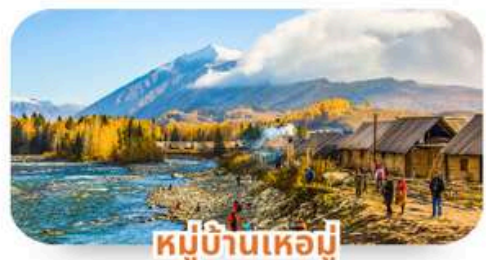
หมู่บ้านเหม่จู