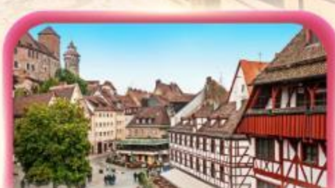
สัมผัสเมืองเก่าบูเรมเบิร์ก