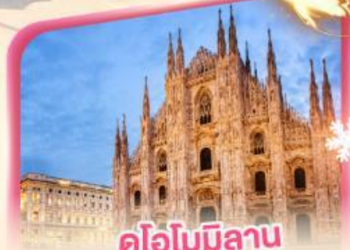
คูโอโมมิลาน