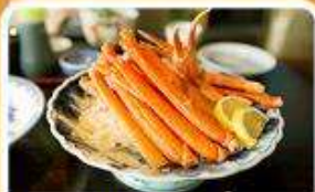
พิเศษ! ชาบู