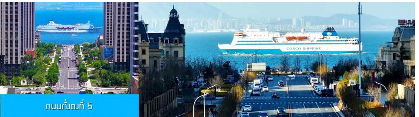
ถนนกว้างที่ 5

จากนั้นนำท่านเที่ยวชม สวนน้ำเมืองเวนิสตะวันออก 大连东方威尼斯城 เป็นเมืองเวนิสจำลองที่ถูกสร้างขึ้นด้วยทุนกว่า 8,000 ล้านดอลลาร์ ออกแบบโดยบริษัท ARC จากประเทศฝรั่งเศส โดยจำลองผังเมืองเวนิสในประเทศอิตาลี บนพื้นที่กว่า 400,000 ตารางเมตร ประกอบด้วยคลองเวนิสและอาคารที่มีสถาปัตยกรรมแบบตะวันตกกว่า 200 หลัง มีบริการล่องเรือคอนโดล่าแก่นักท่องเที่ยว นำท่านเดินชม ถ่ายภาพที่ระลึกท่ามกลาง