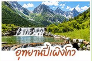
อุทยานปี่ฝิ่งโกว