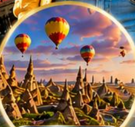
เมืองคปปาโดเกีย Cappadocia