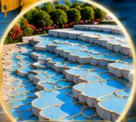
ปานุกคาล์ Pamukkale