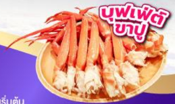
บุฟเฟ่ต์ 3 อย่าง