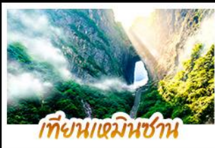
เทียนเหมินชาน

การบตีเที่ยวเต็มอิ่มแบบไม่ลงร้าน • รวม 5 เมืองโบราณชื่อดังไว้ในทริปเดียว ขึ้นเขาอวดคาร์ด้วยลิฟท์แก้วไปหลง • นั่งกระเช้าพิชิตท้ำประตูสวรรค์ที่ยืนหมื่นชา เดินท้าความเสียวบนหน้าผากระเจก • ล่องเรือชมภาพเขียนบนน้ำอุ๊ยเจียง