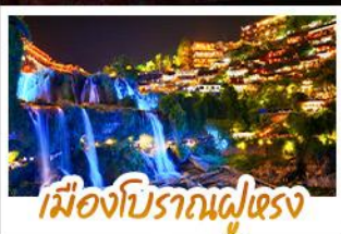
เมืองโบราณผู่เซียง