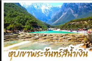
เขื่อนเขาพระจันทร์สีน้ำเงิน