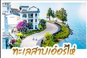
ทะเลสาบเอ๋อร์ไห่