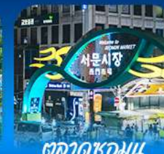
ตลาดช้อปปิ้ง