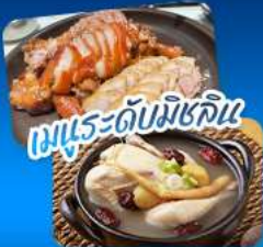
เมนูระดับมิชลิน

เดินทาง 02 - 07 ก.ย. 69 20 - 25 ส.ค. 69 | 17 - 22 ก.ย. 69