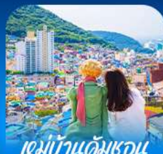
หมู่บ้านคิมชอน