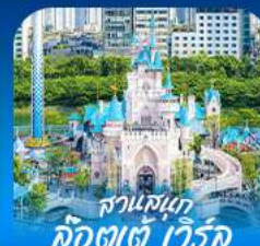
สวนสนุก ล็อดเจตต์ วัลวิค