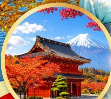
ชมประตูโทเซกิกิจิแชนมอน วัดโทเซกิกิจิ