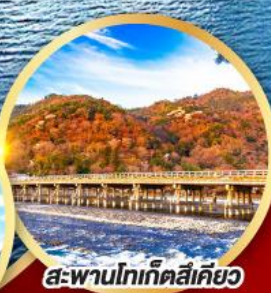
สะพานโทเก็ตสึเคียว