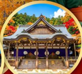
ศาลเจ้าอิสะ