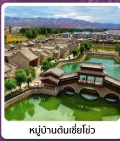
หมู่บ้านตันเซี่ยโซ่ว