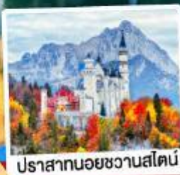
ปราสาทน้อยชวานส์ไตน์

เดินทาง 7วัน 4คืน 02-08 พ.ค.69 24-30 มิ.ย.69 02-08, 16-22 ก.ย.69