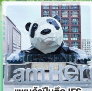
แพนด้าป็นตึก IFS