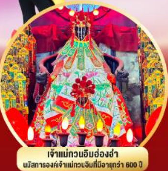
เจ้าแม่ทวนอิมฮ่องกง นมัสการองค์เจ้าแม่ทวนอิมที่มีอายุกว่า 600 ปี