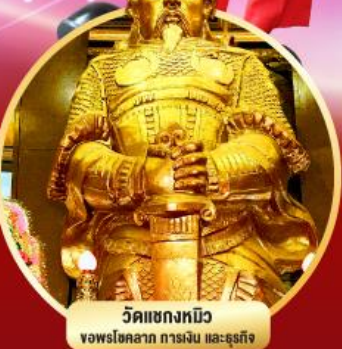
วัดแชกงหมิว ขอพรโชคลาภ การเงิน และธุรกิจ