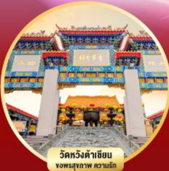
วัดหวังต้าเซียน ขอพรสุขภาพ ความรัก